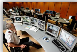
Quadro 10 – Segurança de pessoas e bens