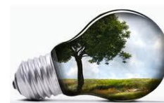
Quadro 14 – Indicadores de eficiência energia

(3) Valores estimados no concurso de fornecimento de energia elétrica para 2014.