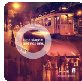
Quadro 26 – METRO | CARRIS – Projetos comuns às duas empresas

Em 2014 pretende-se concluir o processo de reestruturação do METRO e da CARRIS , com o fim de concretizar a sua integração operacional.