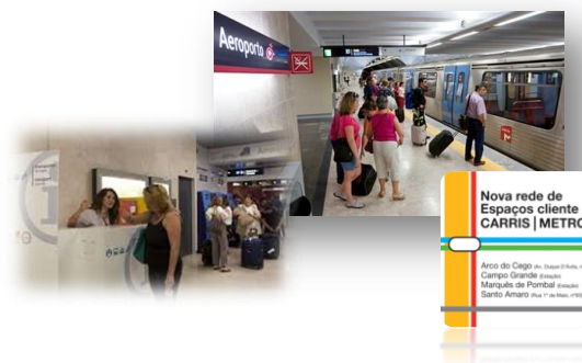
Quadro 8 – Qualidade de serviço – Comercial

Nos indicadores da qualidade destaca-se a redução do número de reclamações por milhão de passageiros transportados ( Quadro 8 ) e o tempo médio despendido por resolução de ocorrências com atraso superior a 10 minutos ( Quadro 9 ).