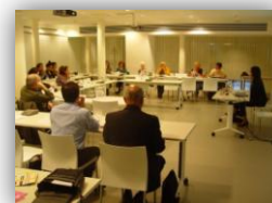
Quadro 23 – Horas de Formação por área