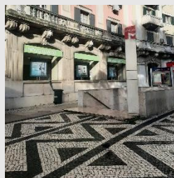
Praça Duque de Saldanha Estação de Metro | Novo Banco