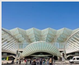
Gare do Oriente Entrada Principal