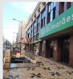
Intendente Estação de Metro | Sapataria Guimarães