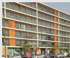
Alcântara - Pingo Doce