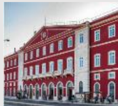
Estação de Sta Apolónia Átrio Principal