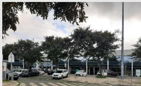
Cais do Sodré - Estação Fluvial